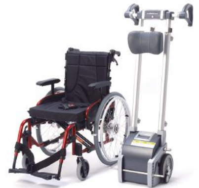
TAISコード00156-000036 TAISコード00156-000037 S35/S38車いすタイプ